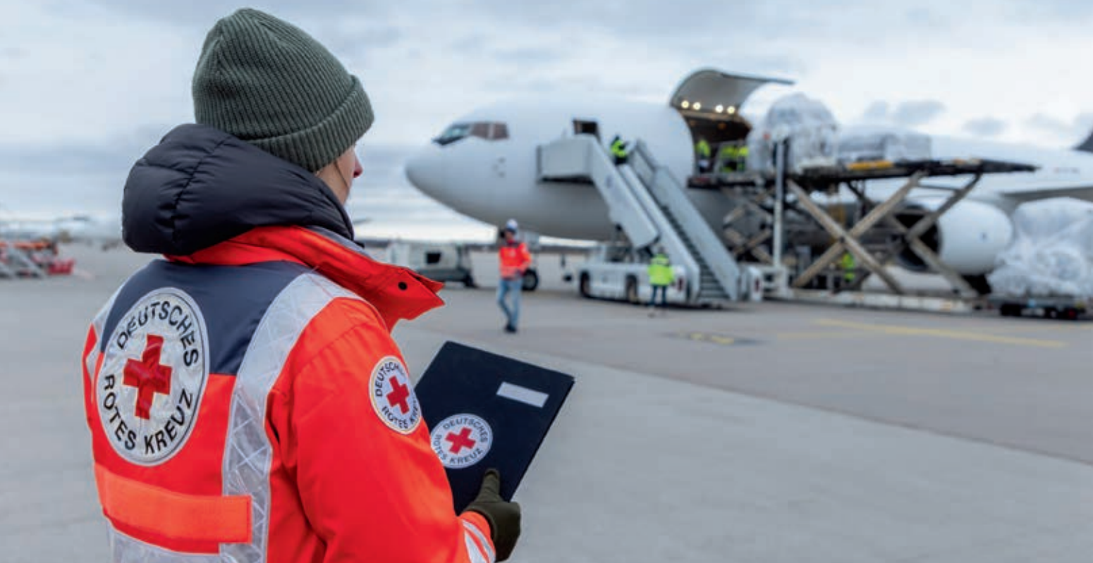
Bewaffneter Konflikt Israel – Palästinensische Gebiete: Hilfsflug des DRK für Gaza mit Zielort Ägypten vom Flughafen Leipzig

zu Katastrophenvorsorge, medizinischen Notfallversorgung und präventiven Gesundheitsversorgung sowie Rehabilitationsdiensten für Kinder mit Behinderungen.