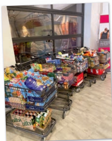
Überquellende Einkaufswagen demonstrieren die beeindruckende Resonanz und Großzügigkeit der Gemeinschaft bei der Spendenaktion.

Der Bus ist vollgeladen mit Spenden. Rotkreuzmitarbeiter und Helfer der Stralsunder Tafel sind überwältigt von der Großzügigkeit der Menschen. Vom gespendeten Bargeld kaufen sie zusätzlich benötigte Lebensmittel ein. Jeder im Team hilft mit, die vielen Waren sorgfältig zu verstauen. Der Tag neigt sich dem Ende zu. Müde, aber erfüllt von dem, was sie erreicht haben, blicken die Spendensammler glücklich auf die Aktion zurück.