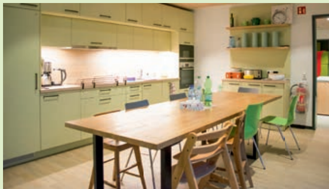
Auf jeder Etage befindet sich eine geräumige Gemeinschaftsküche. Die bunten Möbel sind Teil des Farbkonzepts der Einrichtung.

Rein ins Zimmer, Tür schließen, die Welt draußen lassen und sich gut aufgehoben fühlen: Was selbstverständlich sein sollte, ist es für manche Kinder nicht. Den Schützlingen des Rostocker Jugendhilfeverbundes „Blinkfeuer“ fehlte in den ersten Lebensjahren oft so ein kleines, eigenes Reich – und mit ihm das Gefühl der Sicherheit.